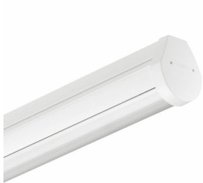
Maxos LED Performer 4MX900 elektrisk enhet