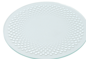
Vetro di protezione a incasso, strutturato