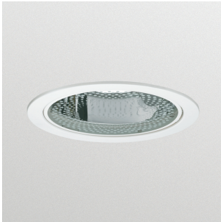
Latina FBH024 incasso con lampade fluorescenti compatte con vetro decorativo