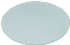
Vetro di protezione smerigliato