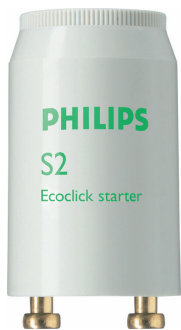
LPPR STARTER PHL 0004