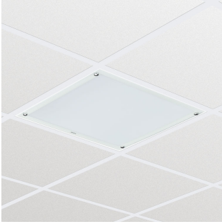
Cleanroom LED-CR250B W60L60