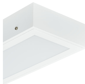
Cleanroom_LED- CR250B_W60L60_CR250Z_SMB- DP14