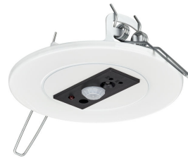
PowerBalance Tunable White, recessed DP