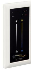
PowerBalance Tunable White, recessed DP