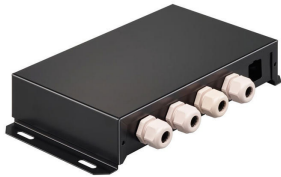
PowerBalance Tunable White, recessed DP