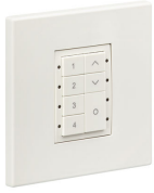
PowerBalance Tunable White, recessed DP