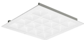
PowerBalance Tunable White, recessed RC466B W62L62 DP