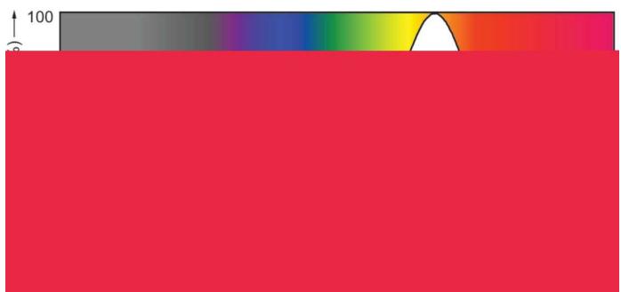
Spectral Power Distribution Colour - MAS LEDspotLV VLE 3.4-20W 827 MR16 36D