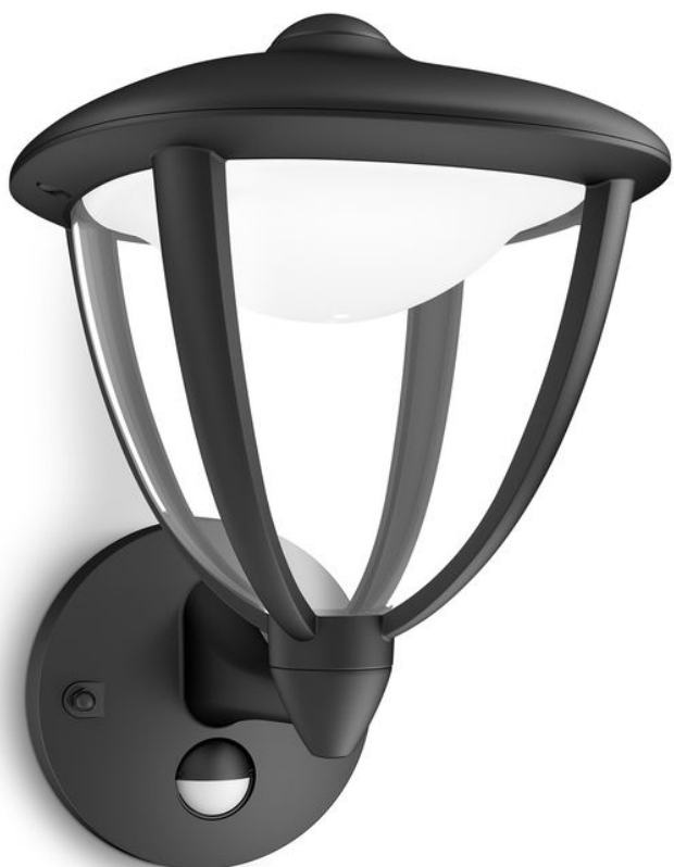
PHILIPS myGarden Applique murale Robin noir LED