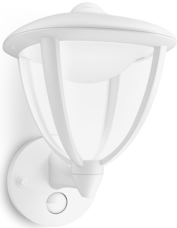
PHILIPS myGarden Applique murale Robin blanc LED