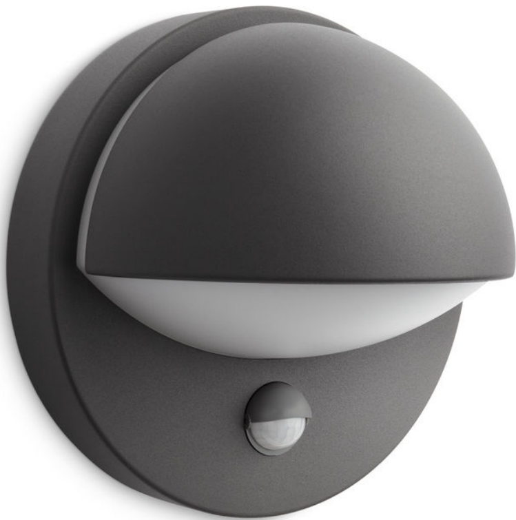
PHILIPS myGarden Applique murale Juin anthracite