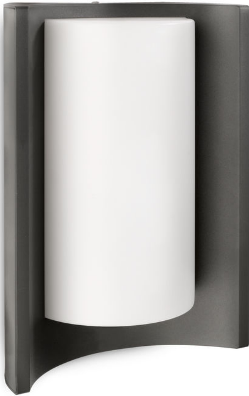
PHILIPS myGarden Applique murale Meander anthracite