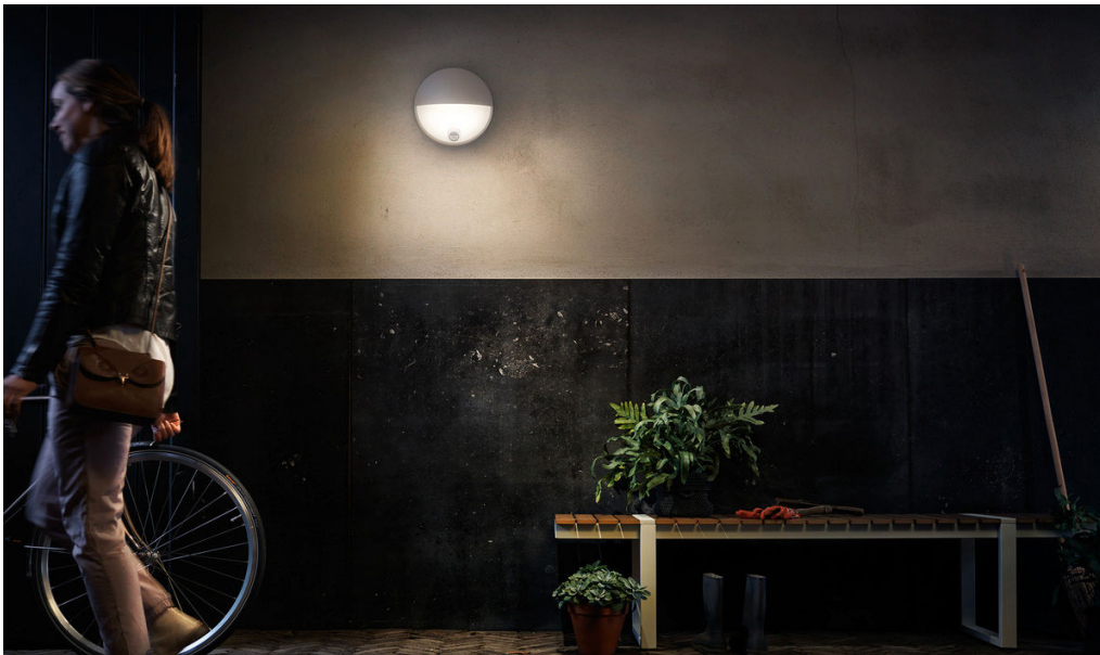
PHILIPS myGarden Applique murale Capricorn IR gris LED