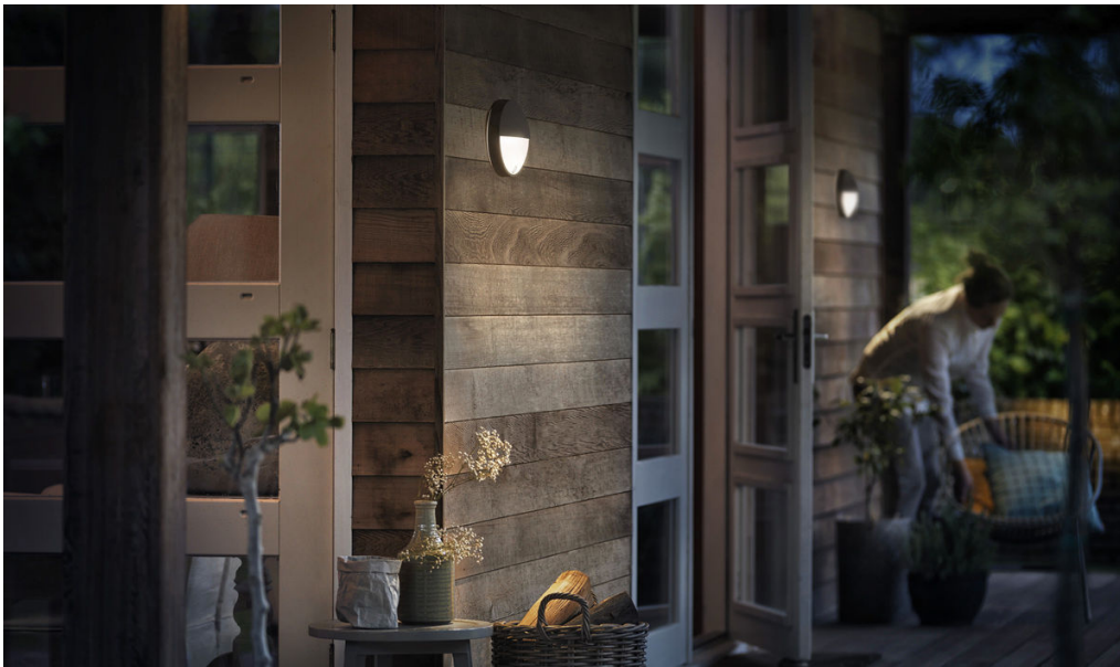
PHILIPS myGarden Applique murale Capricorn IR anthracite LED