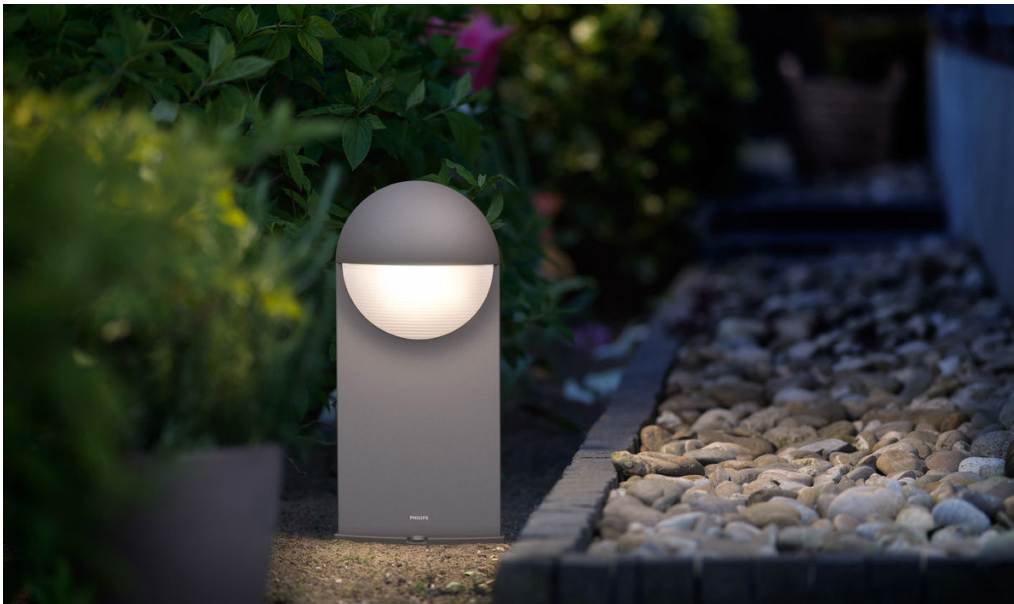
PHILIPS myGarden Latarnia Capricorn szary LED