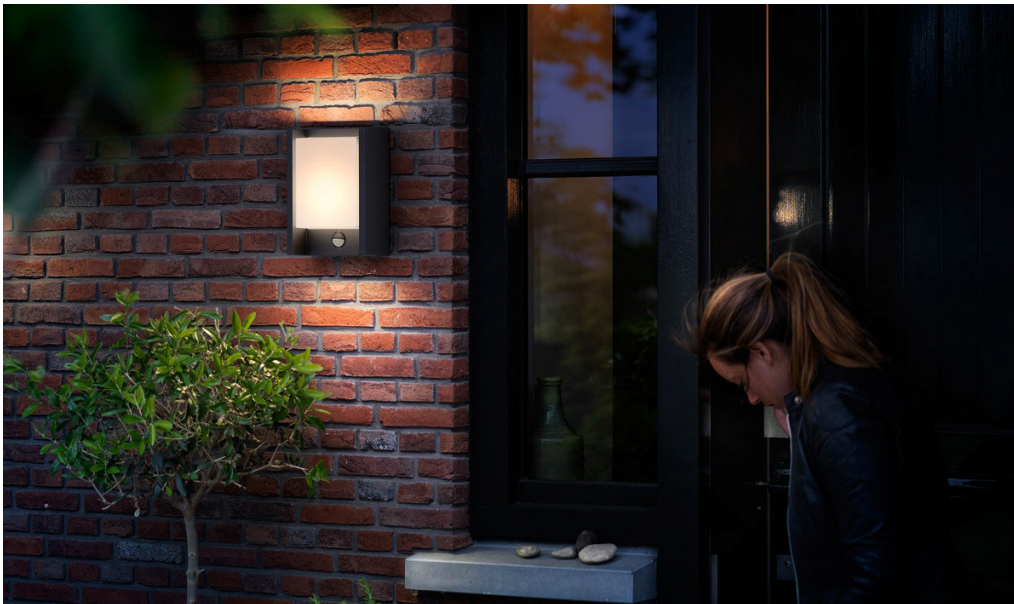
PHILIPS myGarden Applique murale Arbour IR anthracite LED