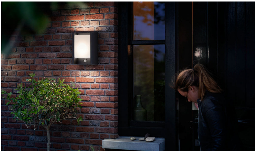
PHILIPS myGarden Applique murale Arbour IR 4 000K anthracite LED