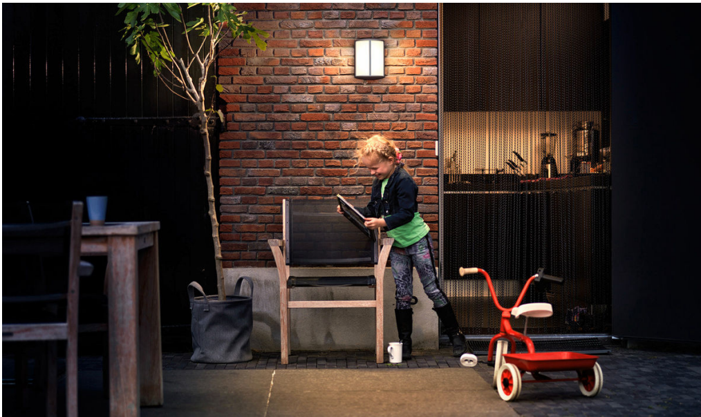
PHILIPS myGarden Vegglampe Stock antrasitt LED