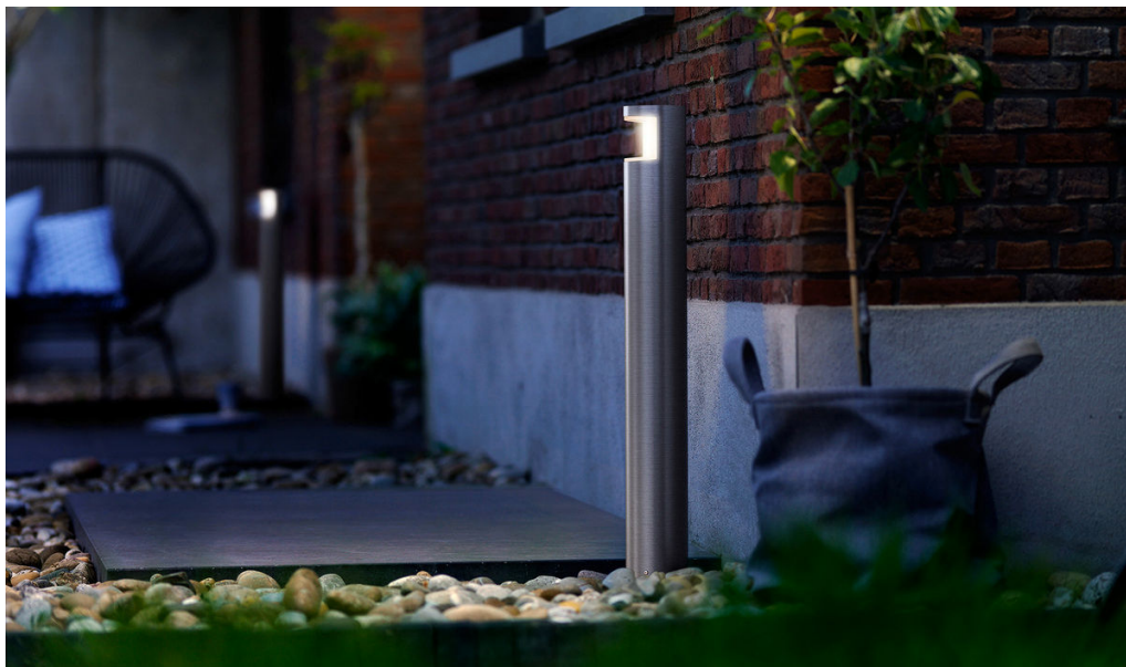
PHILIPS myGarden Latarnia Squirrel stal nierdzewna LED