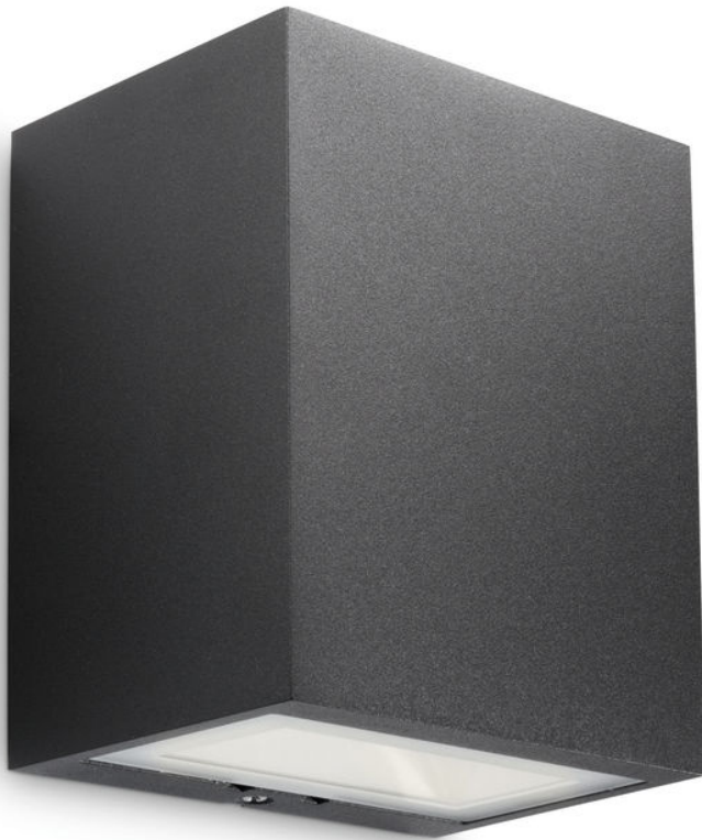
PHILIPS myGarden Wandleuchte Flagstone Schwarz LED