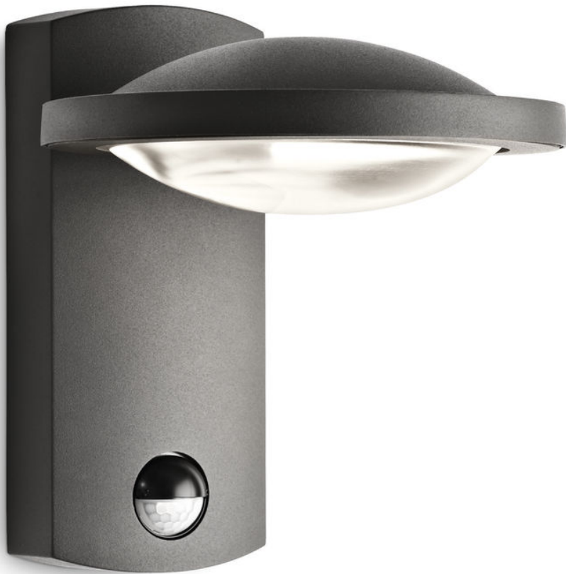
PHILIPS myGarden Applique murale Liberté anthracite LED