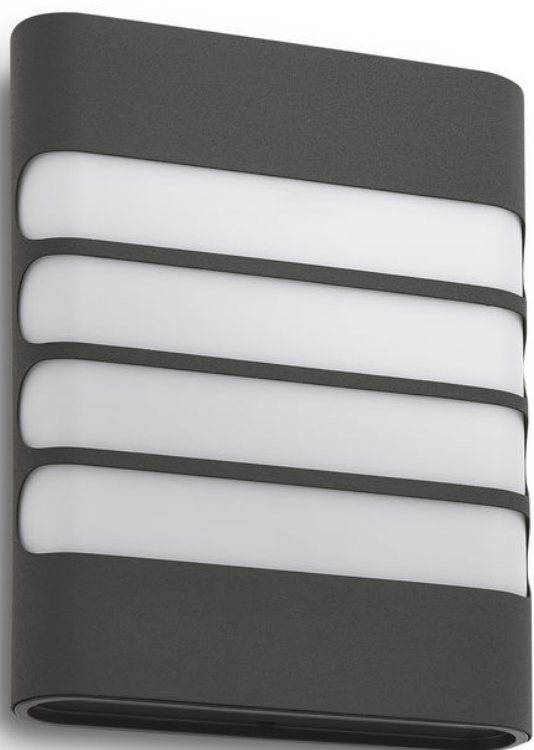
PHILIPS myGarden Applique murale Raccoon anthracite LED