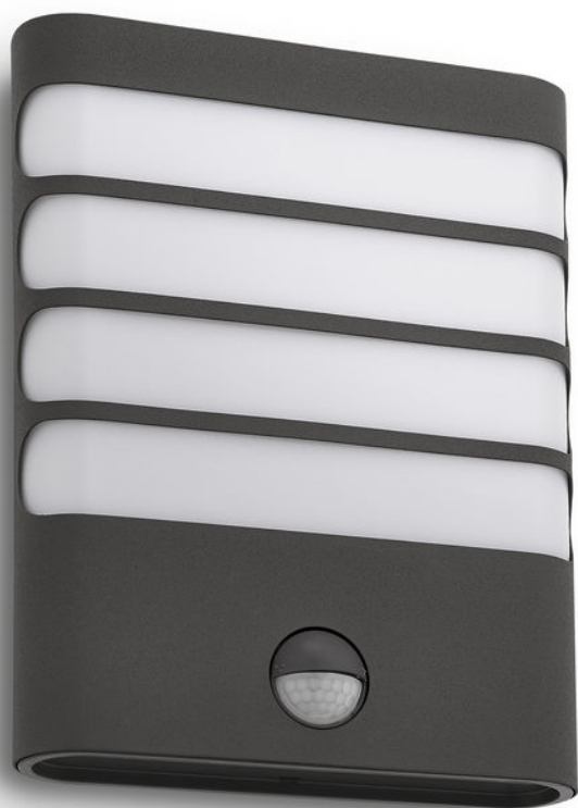
PHILIPS myGarden Applique murale Raccoon anthracite LED