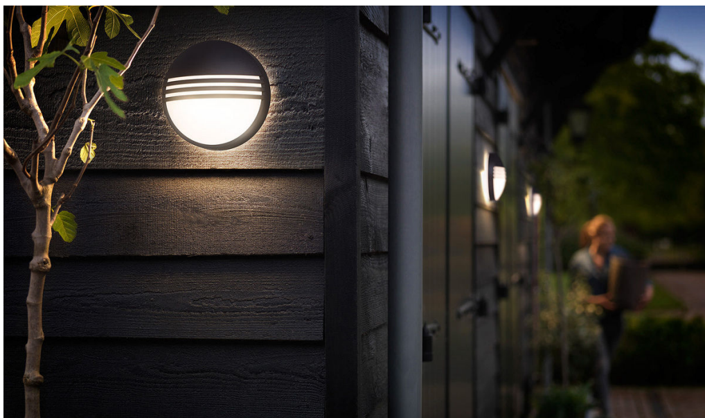
PHILIPS myGarden Applique murale Yarrow noir LED