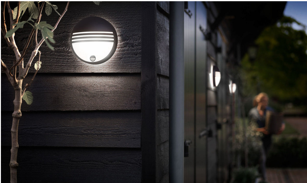
PHILIPS myGarden Applique murale Yarrow 4 000K noir LED