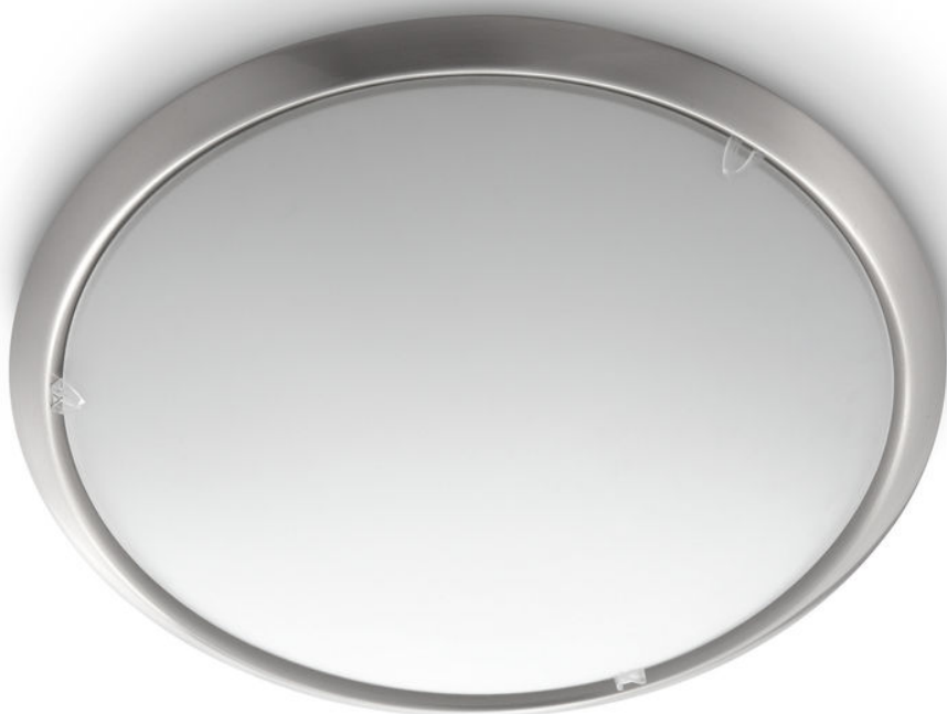
PHILIPS myLiving Plafon Circle cromado mate