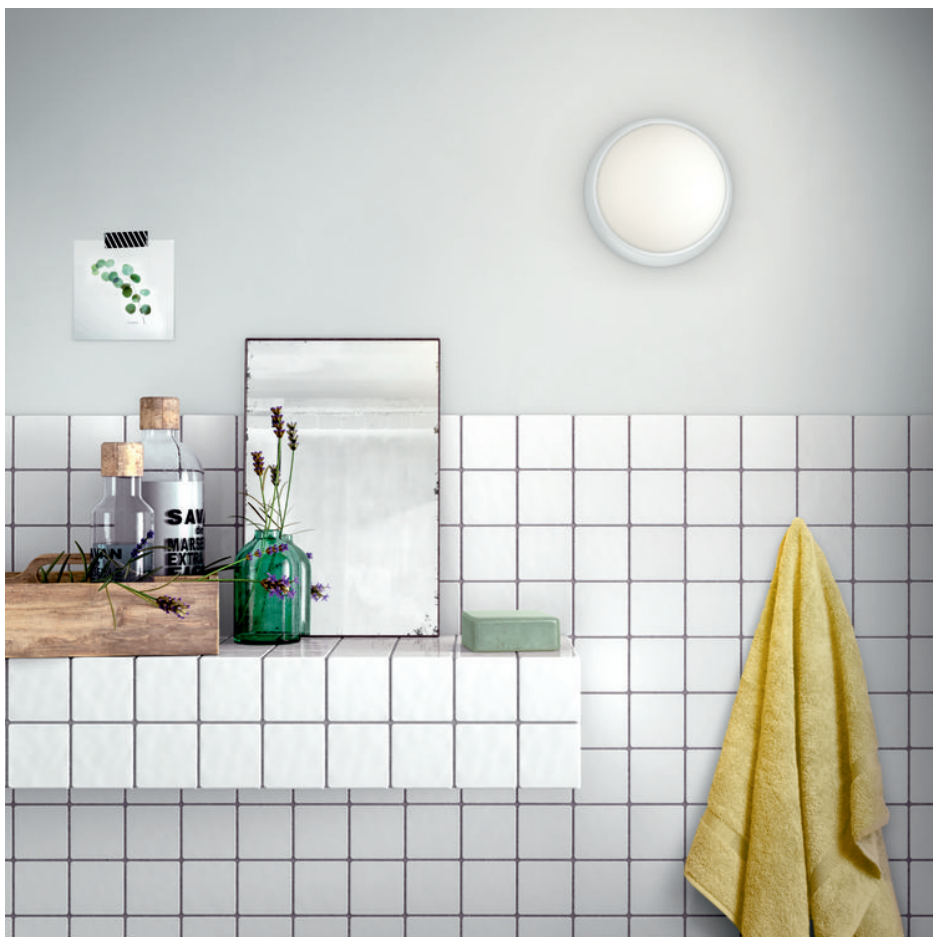
PHILIPS myBathroom Plafon WATERLILY branco LED