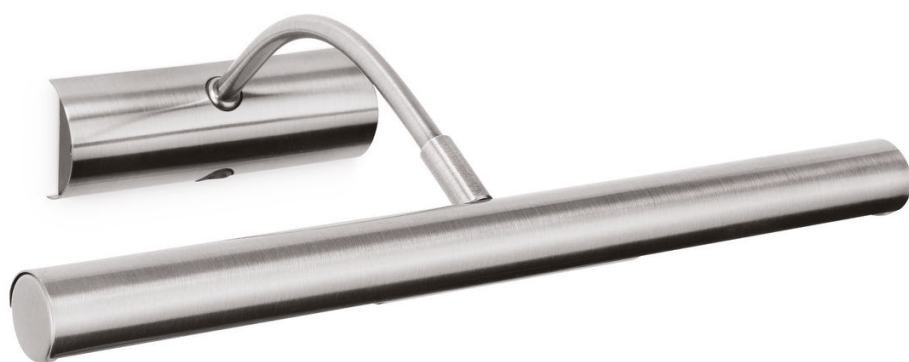
PHILIPS myLiving Stenska svetilka Langston mat krom