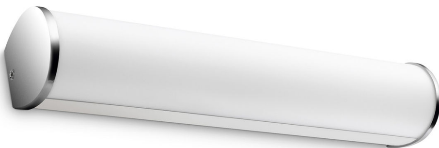
PHILIPS myBathroom Aplique Fit cromado LED