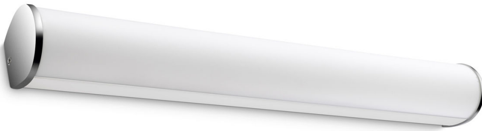
PHILIPS myBathroom Aplique Fit cromado LED