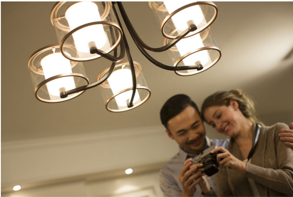
PHILIPS myLiving 吊灯 40935 Outline 青铜色