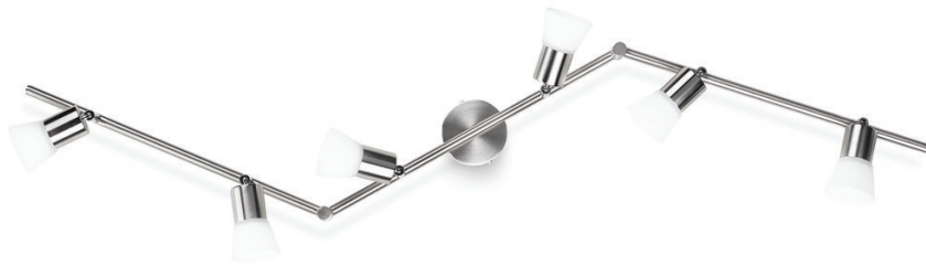
PHILIPS Essentials Spot decagon mat chroom LED