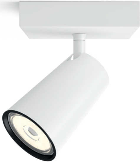
PHILIPS myLiving Spot PAISLEY white