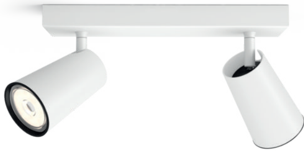
PHILIPS myLiving Spot PAISLEY white