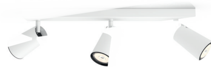
PHILIPS myLiving Spot PAISLEY white