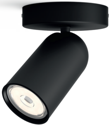
PHILIPS myLiving Spot PONGEE noir