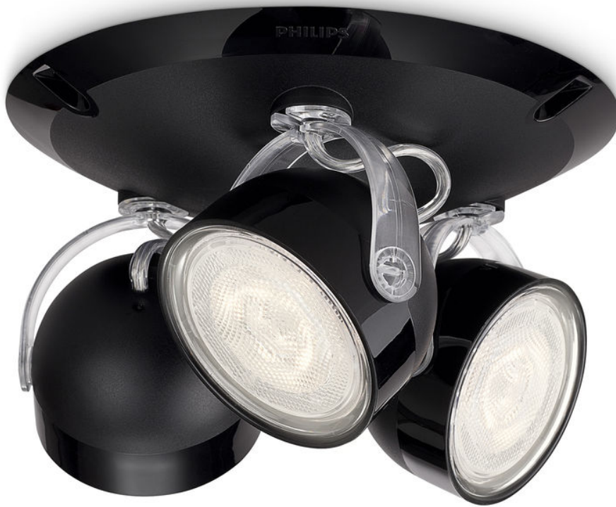
PHILIPS myLiving Spot DYNA noir LED