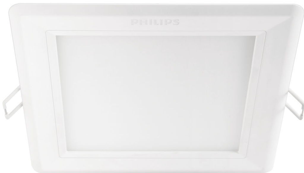
PHILIPS Spot încastrat HADRON alb LED