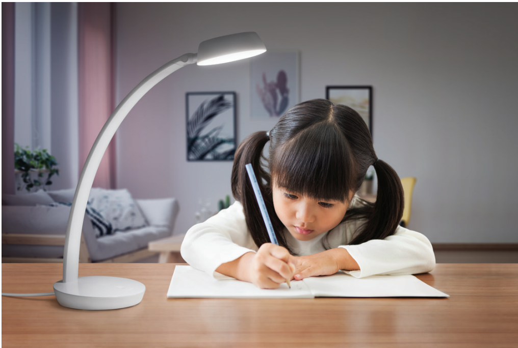
PHILIPS 桌灯 Donut 66109 白色 LED