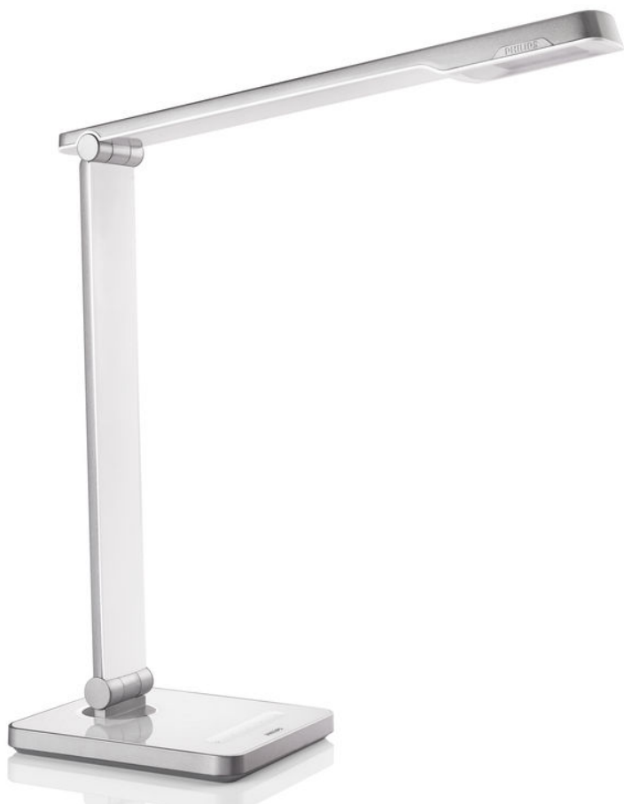
PHILIPS Lampe à poser CALIPER white LED