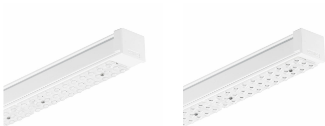
Maxos LED 4MX400 renovatievervanger