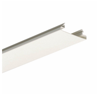
9MX056 BC49 SI