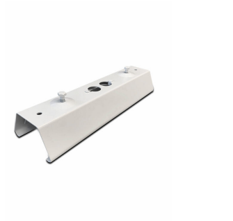
9MX056 CP WH