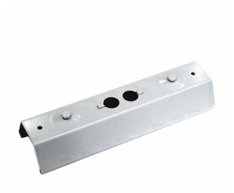
9MX056 CP SI