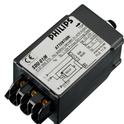
SDU-01/H 220-240V 50/60Hz