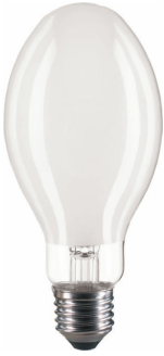
LPPR SON E27 E26