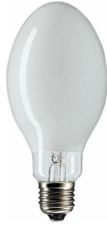
LPPR SON-I CO