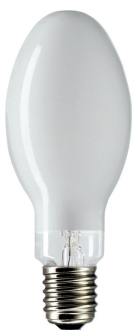
SON H, E40