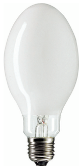
LPPR SON-H E27