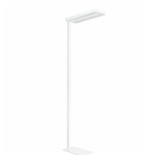
SmartBalance FS484F stojanové svítidlo s ActiLume