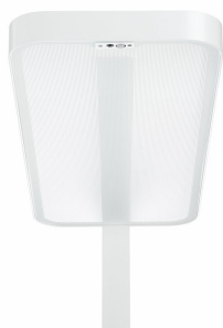
Všechny verze jsou vybaveny akrylátovou mikročočkovou optikou.