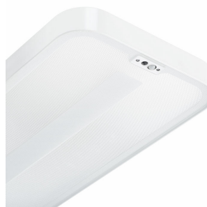
Senzor ActiLume umístěný ve svítidle umožňuje regulaci podle denního světla a stmívání při nepřítomnosti osob