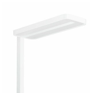
SmartBalance FS484F stojanové svítidlo se samostatným spínáním