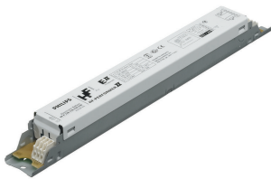
HF-P Xt 136 TL-D EII 220-240V 50/60Hz