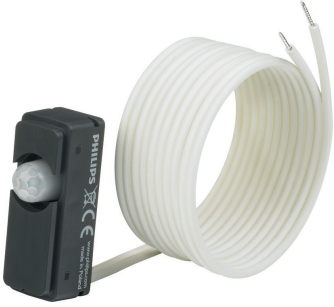
LRM8140/00 ActiLume G2 RF Mov Sensor