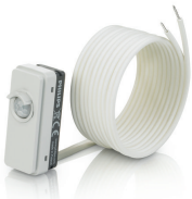
LRM8119/00 Lum Based Ext Sensor with LCA8004/00 COVER