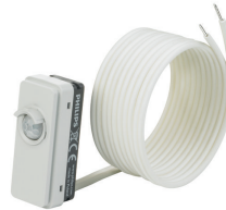
LRM8119/00 Lum Based Ext Sensor with LCA8004/00 COVER