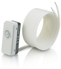
LRM8119/00 Lum Based Ext Sensor with LCA8004/00 COVER