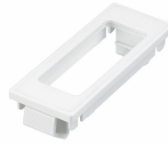
LRM8120/05 Lum Bas Ind Ext Sensor H513 N