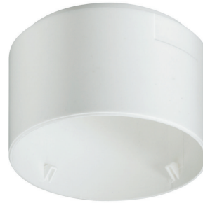
LRH2070/00 SURFACE BOX