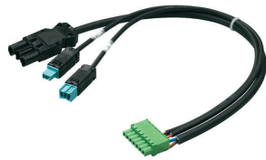
LCC2070/00 CABLE BASIC